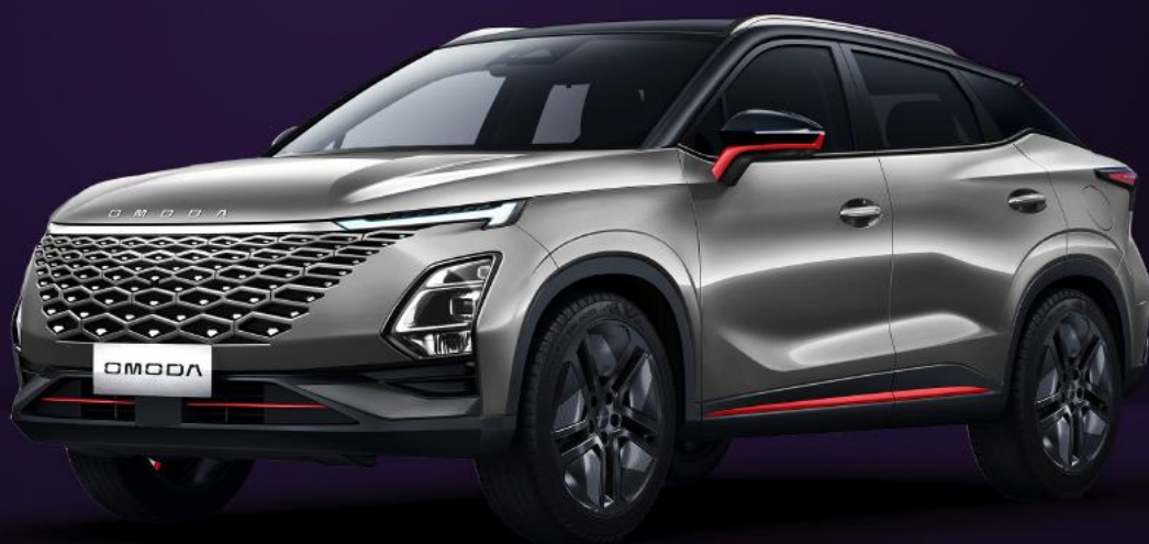
UHLÍKOVĚ ČERNÁ A KOVOVĚ STŘÍBRNÁ RED TRIM (X41)