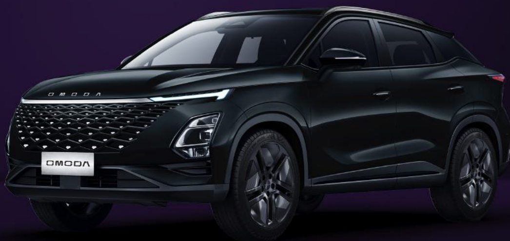
UHLÍKOVĚ ČERNÝ KRYSTAL (CLO)