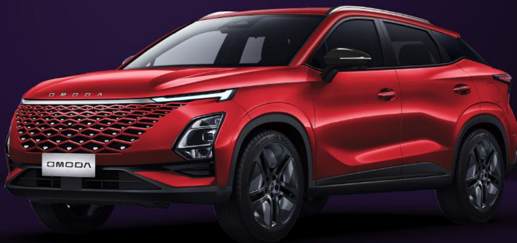
KRVAVĚ ČERVENÁ (NLO)