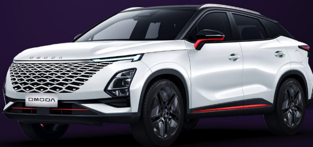
UHLÍKOVĚ ČERNÁ A KHAKI BÍLÁ RED TRIM (ZE1)