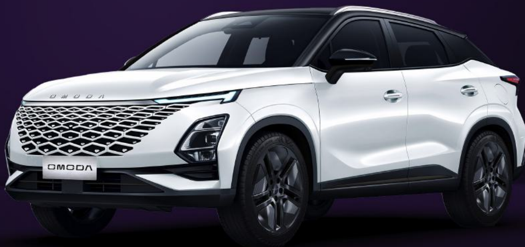
UHLÍKOVĚ ČERNÁ A KHAKI BÍLÁ (ZE0)