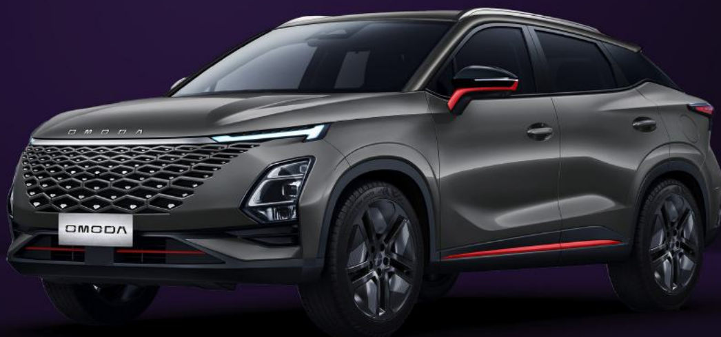
FANTOMOVĚ ŠEDÁ RED TRIM (GV1)