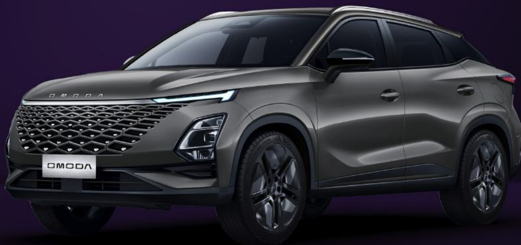
FANTOMOVĚ ŠEDÁ (GV0)