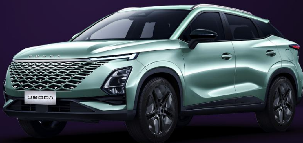
VODNÍ ZELENÁ (SK0)