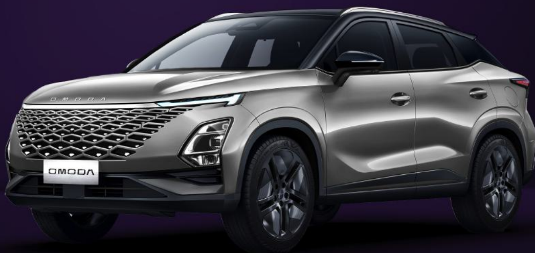
UHLÍKOVĚ ČERNÁ A KOVOVĚ STŘÍBRNÁ (X40)