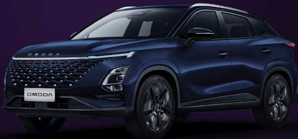
NOČNÍ MODRÁ (WB0)